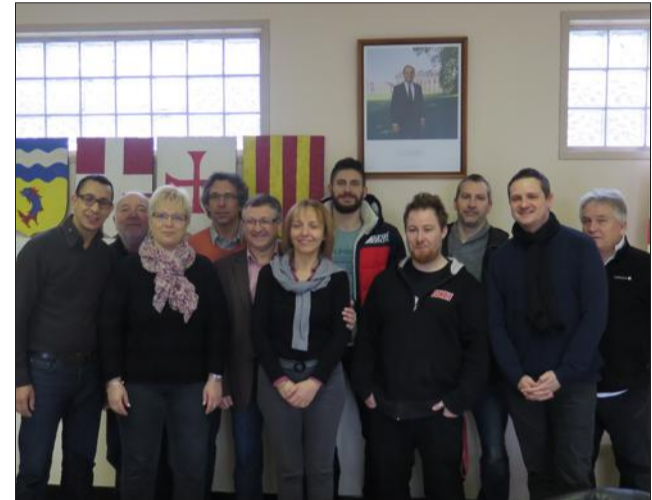
Cette équipe partie de rien a réussi en quelques semaines à créer un engouement tel que l'événement prend de l'ampleur et mobilise de plus en plus de bénévoles.