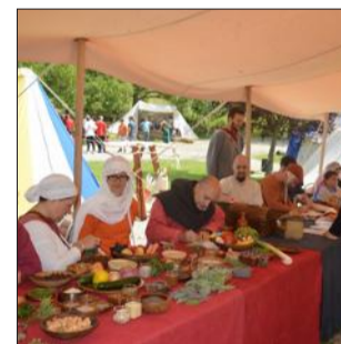
Excalibur Dauphiné et Chambaran sont deux associations spécialisées dans les reconstitutions grandeur nature de l'époque médiévale : elles mobiliseront 100 de leurs membres pour proposer combats d'épées, tir à l'arbalète, banquets ou danses...