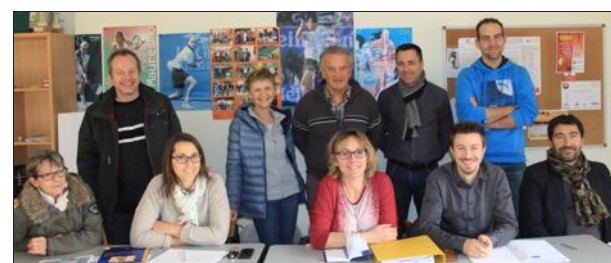
Les cadres du tennis club au travail.

Le bureau du tennis club se réunit tous les mois pour discuter des sujets qui animent la vie du club et des projets à mener dans le futur. L'ordre du jour de la dernière réunion a notamment comporté les inscriptions des équipes aux championnats de printemps mais aussi les