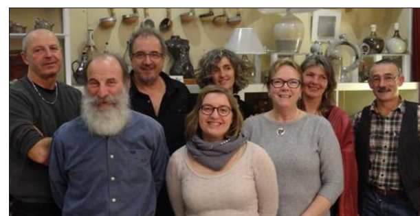
Les artistes du cru rassemblés autour de l'association "Entrer en matière".