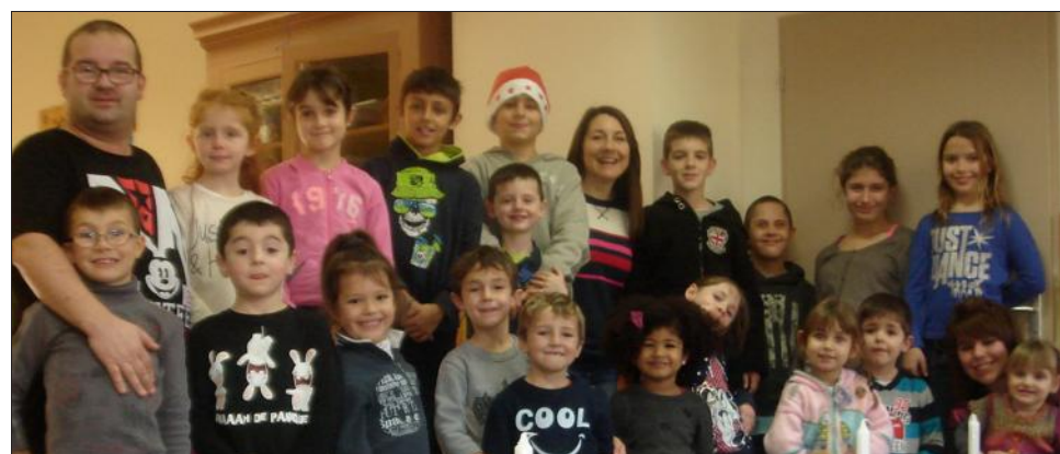
Les enfants ont cuisiné comme des chefs et ils se sont ensuite régalés.

Mercredi au Moulin, un repas d'exception a été préparé par les enfants fréquentant le centre de loisirs. Tout le monde a mis la main à la pâte pour organiser ce repas de fête. Il y avait aussi les jolies décorations qui