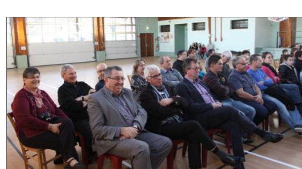
Le conseil communautaire est bien représenté.

Tous les enfants et les employés de la communauté de communes des Vallons de la Tour se sont bien amusés lors du spectacle donné à la salle Marcel Vergnaud en présence du père Noël. Les élus communautaires, sagement assis au fond de la salle, n'ont pas manqué de partager ce moment de détente pour tous, dans la bonne humeur.