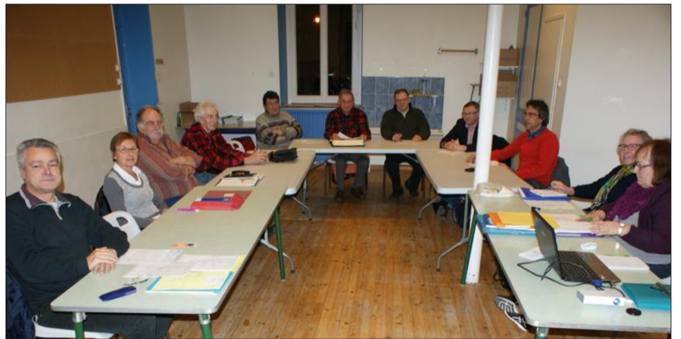
L'association locale "Histoire et patrimoine de Saint-Victor" participe à cette journée.

Les membres de l'association locale se tiendront sur le parking du cimetière de 10 à midi et de 14 h à 17 h pour accueillir les visiteurs, la visite sera libre, les tombes qui présentent un intérêt particulier seront identifiées.