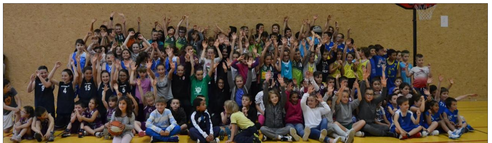
Le tournoi de Pentecôte du TFB a commencé samedi avec les catégories jeunes U7 à U11. Dimanche, place aux U17 (en photo), U20, Seniors féminines et Seniors garçons avec respectivement pour vainqueurs TFB, BVT, Saloon, une équipe spéciale tournoi et TFB.