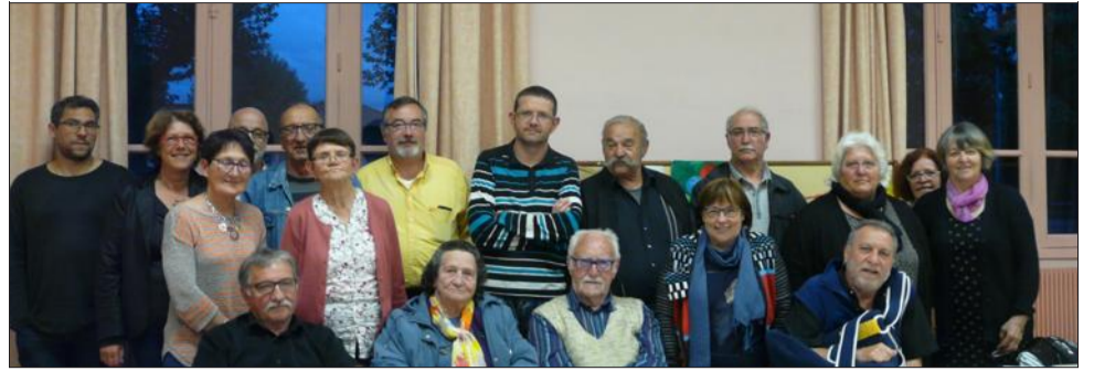
Les bénévoles ont une motivation à toute épreuve pour la mise en place des manifestations prévues sur la fin d'année.

nettes le 3/12. En attendant pour l'association de finaliser le programme de la saison 2016, des animations sont à définir et d'autres pistes sont à creuser, notamment une intervention des conscrits, une éventuelle pièce de théâtre, et le Cessieuthon qui devrait se remettre sur les rails comme auparavant. « Nous allons contacter les conscrits d'après une liste émise par la mairie » annonce l'association.