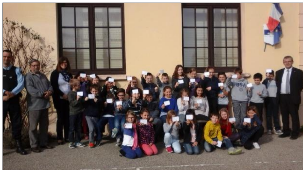
Tous les enfants de CM1-CM2 ont eu leur permis piéton.

Sur une proposition du conseil municipal des enfants et avec l'encadrement des enseignants, les élèves des classes CM1-CM2 de Flachères ont passé leur permis piéton. Après une première phase de "formation" par les gendarmes sur les