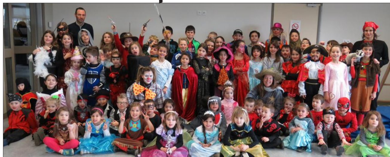
Il y avait de l'animation à l'école.

Mercredi, les enfants de l'école primaire se sont déguisés. Dans la cour, il était agréable de voir Spiderman côtoyer des danseuses espagnoles et des pirates jouer avec des princesses... Les enseignantes ont aussi joué le jeu et ont revêtu des costumes tout en couleurs pour le plus grand plaisir des enfants.