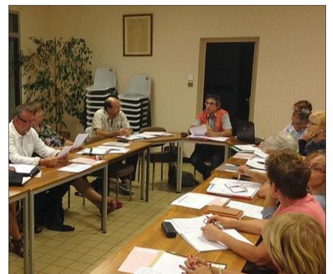
Le devenir de la place de Vaux a été évoqué durant le conseil de rentrée.

Enfin, les adjoints ont évoqué, l'avancement de la maison de santé, les travaux dans la forêt de Vallin, les cheminements piétonniers, les affaires scolaires et les travaux ou projets en cours. Après les affaires sociales, le calendrier des manifestations, le recensement de la population prévu début 2016 ont été présentés.