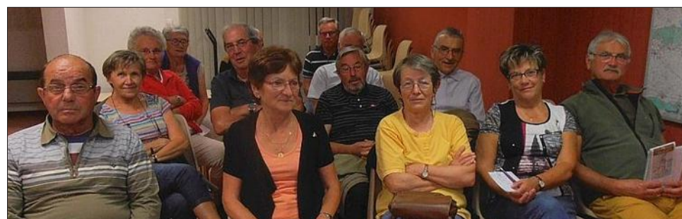
La journée randonnée, de Valencogne à Paladru a été préparée lors de réunions.

Jeudi 24 septembre, Chesenvat s'associe à Générations mouvement pour une randonnée pédestre ouverte à tous. Les bénéficiaires seront reversés à Solidarité Madagascar, qui aide à la construction et au fonctionnement