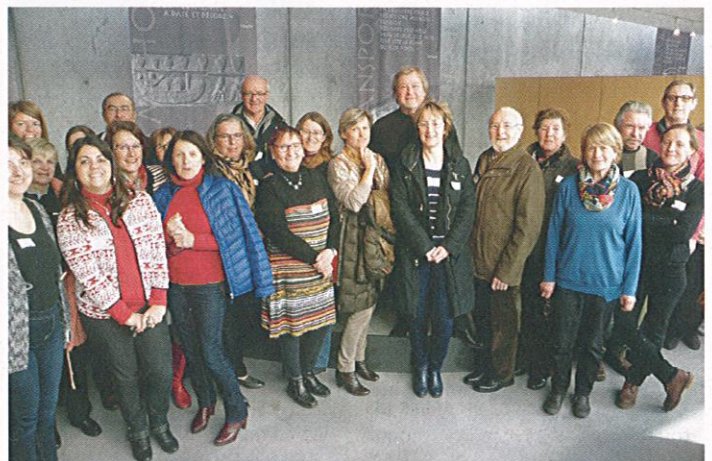
Une partie du groupe invité par le musée d'Aoste et la Maison d'Izieu

Contacts : http://www.musee-aoste.fr 04 76 92 58 27 http://www.memorializieu.eu ou 04 79 87 21 05