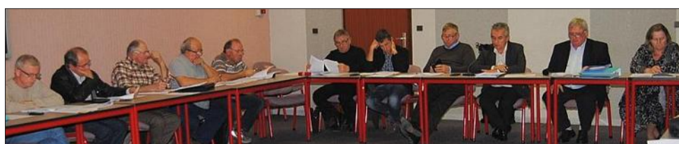
Le Comité syndical des eaux de Montcarra a fait le point sur ses projets de travaux dans tout son secteur qui est vaste.

Pour l'eau potable, le syndicat définit les investissements à réaliser lors des prochaines années pour sécuriser le réseau. Sont notamment prévus,