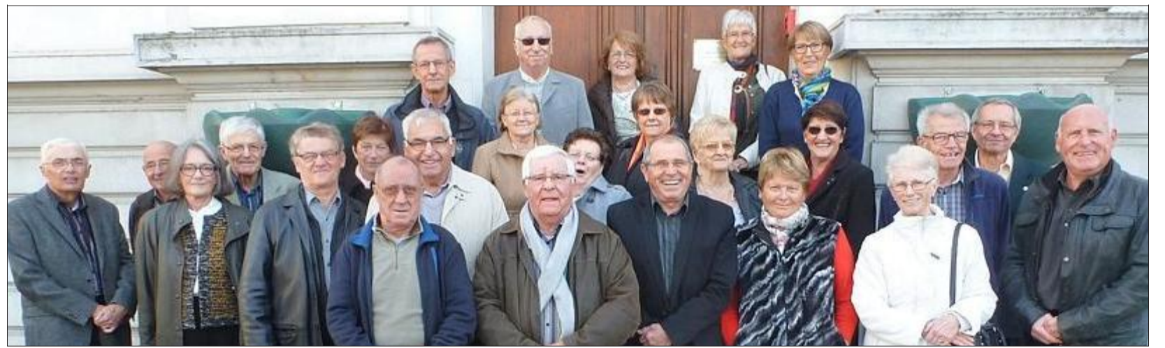
Les conscrits de la classe 45 et leurs conjoints tous heureux de passer cette journée de retrouvailles ensemble.

En se quittant il y a dix ans, ils s'étaient promis de nouvelles retrouvailles pour fêter leurs 70 ans. Une promesse que ces natifs de 1945 ont honorée