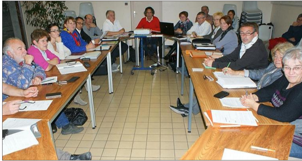
Un vote à bulletins secrets a validé l'entrée de Saint-Victor aux Vals du Dauphiné par 12 voix pour, 4 contre et 3 blancs.

Après les sujets relatifs au PLUi et à l'avenir de la place de vaux, c'est le principal ordre du jour de cette séance qui a été évoqué.