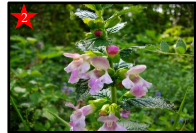
des découvertes permanentes