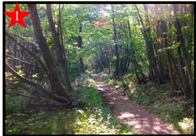
les nombreux sentiers parcourant la forêt