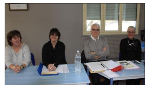
Le bureau de la Boule Favergeoise a bien organisé ce challenge.

L a Boule favergeoise organise, aujourd'hui, le concours doté du challenge Collonge. Il est encore temps de s'inscrire pour cette manifestation sportive très prisée des boulistes de la proche région.