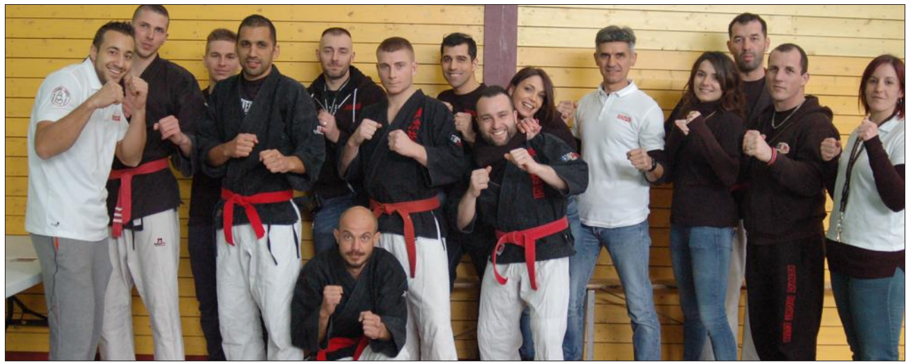
Les familles et amis des défunts remettront les coupes et médailles aux combattants à l'issue de la soirée au gymnase.

La compétition sera axée sur de nombreuses démonstrations impliquant enfants et adultes. Huit combattants du KCNI monteront sur le ring pour offrir, le temps d'une soirée, des combats spectaculaires aux visiteurs.