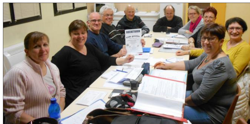
Les membres du Foyer d'animation rural éducatif peaufinent ce rendez-vous, qui aura lieu le 24 avril.

L es membres du Foyer d'animation rural éducatif (Fare) ont peaufiné l'organisation de leur vide-greniers annuel.