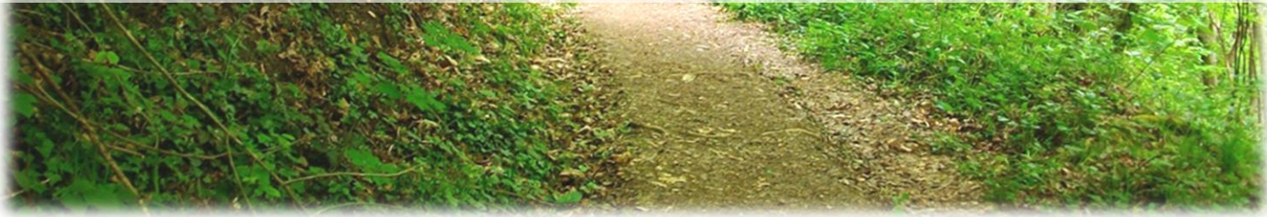
Chemin des Combes

La forêt communale de Saint Victor de Cessieu, d'une superficie de 61,88 ha totalement boisée, est affectée principalement à la production de bois d'œuvre résineux, feuillus et de bois de chauffage, tout en assurant la protection générale des milieux et des paysages.