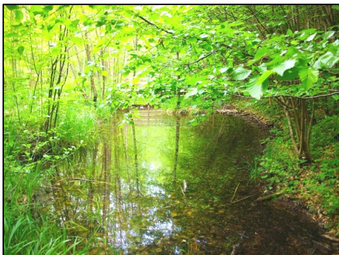
Mare (chemin des Combes)

Cette forêt présente également une richesse faunistique certaine, nous tenons à vous présenter quelques espèces qui ont retenu notre attention. Dans la mare des Combes et dans les différents points d'eau, on peut observer trois espèces remarquables d'amphibiens: