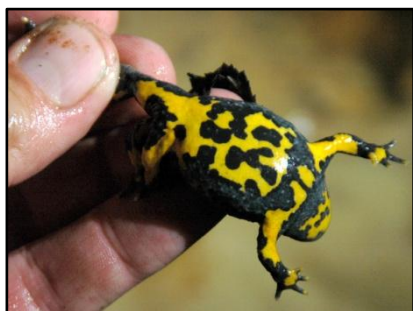
crapaud sonneur à ventre jaune