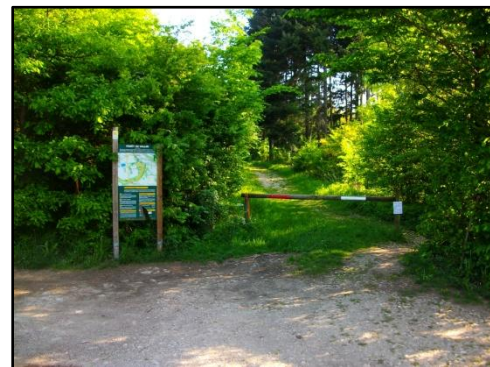
Entrée des 4 sapins