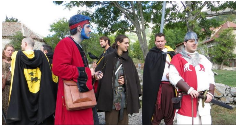
Plus de 130 personnages costumés évolueront sur les deux journées.

À un mois et demi de l'événement, chaque détail prend déjà en compte une projection de l'organisation pour les prochaines années. Le samedi soir à partir de 20 heures, un grand repas médiéval réunira cent personnes dans la pure tradition des repas moyenâgeux. L'accès au banquet se fera uniquement sur réservation