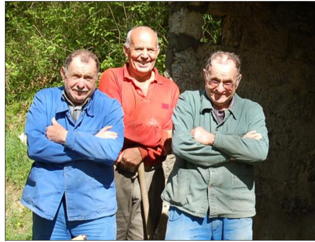
Ces 3 hommes-là ont pour la cabane, comme le dirait Jules Renard, des rêves d'empereur. Une belle initiative à soutenir...

Bientôt, la petite cabane de vignes sera entièrement reconstruite, et décorée avec les éléments de l'époque, outils, tabouret, etc. Une