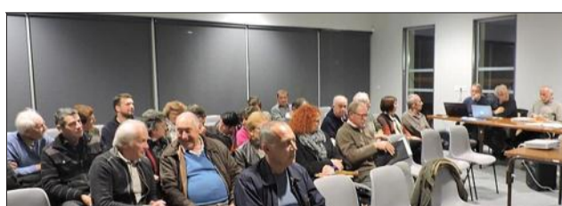
Élus et population se sont retrouvés pour une réunion d'information sur le PLU.

Les élus avaient organisé une seconde réunion publique au sujet de Plan Local d'Urbanisme et avaient convié l'ensemble de la population à la nouvelle Maison pour Tous. Le projet d'Aménagement et de Développement Durable, le PADD était au cœur des débats. Depuis novembre 2014, la commune révise son POS, plan d'occupation des sols pour élaborer son PLU. Lors de la 1 ère réunion, les élus avaient présenté la procédure du PLU, le cadrage du SCOT Nord Isère et le diagnostic territorial de la commune. Cette 1 re phase de travail a permis ainsi d'élaborer le projet communal ou PADD qui va se décliner à travers 5 objectifs, le 1 er étant de pérenniser l'activité agricole. Un des autres