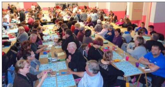
Les amateurs de loto étaient au rendez-vous.

Le premier samedi de novembre est une date inscrite depuis des années dans le calendrier des manifestations de l'AS Valondras. C'est le samedi réservé à la soirée loto. Et les amateurs le notent sur leurs agendas, d'une année sur l'autre. Les organisateurs n'ont pas failli à la tradition, et dès 19 h 30, à l'ouverture des portes de la salle des fêtes, les férus de loto prenaient place. La salle était encore cette année pleine, et les nombreux cartons, bien alignés devant chaque participant. Les différentes parties ont comblé de plaisir les gagnants. Parfaitement managée par une