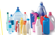
les bouteilles et flacons en plastique