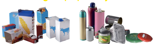
les briques alimentaires et les emballages en carton