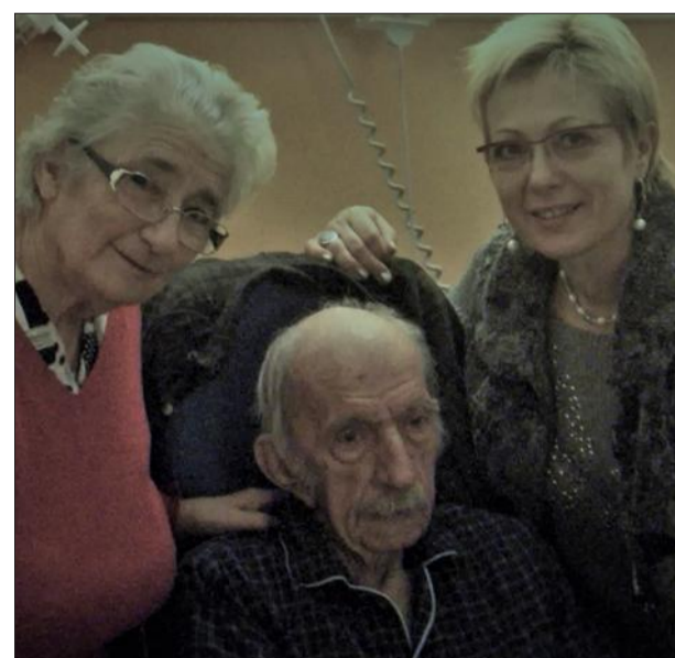
Cette visite est aussi l'occasion d'échanger ou encore d'apporter un peu de réconfort à ceux que leur santé a éloignés de leur domicile.