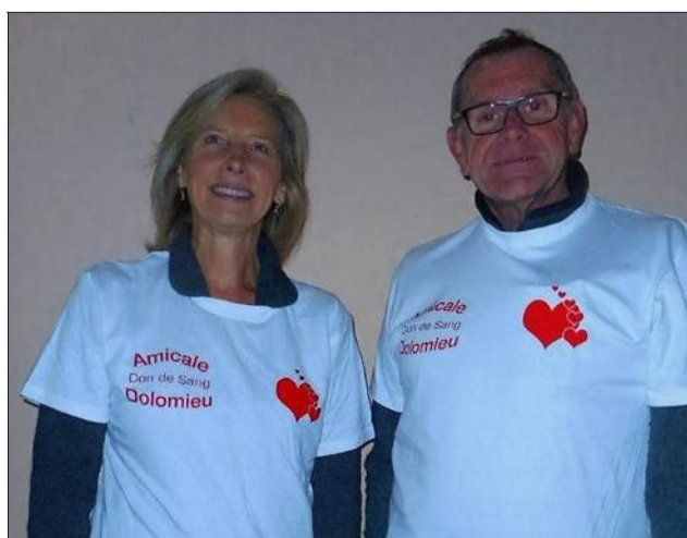
À la collecte du mois de novembre, les nouveaux donateurs s'étaient vu offrir un maillot de l'amicale.