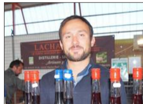
Le propriétaire de la distillerie artisanale Lachanèche, explore la diversité des saveurs du terroir et utilise que des fruits et des plantes sauvages bio.

Le 14e Salon des Vins et Saveurs organisé par l'association Couleurs et Culture était le rendez-vous incontournable ce week-end, pour tous les producteurs et professionnels des vins, spiritueux, produits du terroir, ou accessoires. C'était la rencontre avec de nombreux amateurs, initiés ou connaisseurs désireux de compléter ou diversifier leur cave et découvrir de nouvelles saveurs. Près de 50 exposants venus de toute la France ont fait découvrir et déguster le meilleur de leur production.