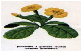
primula à grandes feuilles (primula grandiflora)