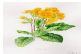
primula à grandes feuilles (primula grandiflora)